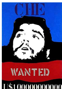
Che Guevara, 1967.

Rubens Gerchman foi um pintor, desenhista, escultor e gravador carioca, considerado por alguns críticos como representante brasileiro do movimento Pop Art .